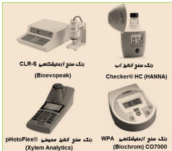
شکل-۳. چند نمونه دستگاه رنگ سنج.

این فناوری با ترکیب بی‌نظیر سرعت، دقت، سادگی و مقرون‌به‌صرفه بودن، در واقع تجسم عینی علم در خدمت امنیت ملی است و توسعه آن تضمین‌کننده ارتقای توان دفاعی و کاهش آسیب‌پذیری در برابر تهدیدات شیمیایی خواهد بود.